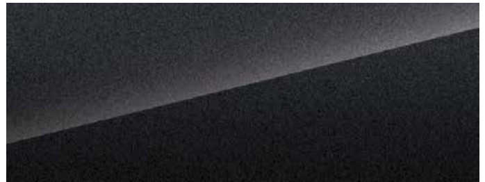
Silver sand Black